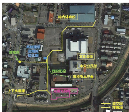
コンパクトグリッド1（行政エリア）全体図