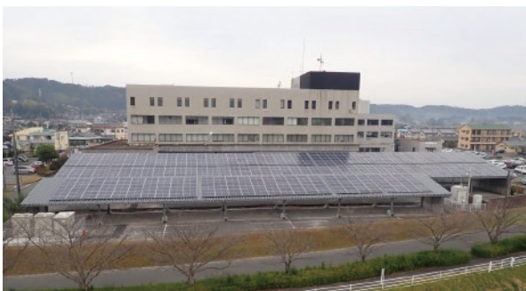
コンパクトグリッド1（行政エリア）太陽光全景

また、一時的に電力使用量が多くなりそのために契約電力が高くなっている需要家のために、太陽光発電やコージェネによる電力供給を行い、電気料金を低減させるということも求められていた。