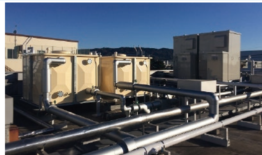
設置された地中熱ヒートポンプシステム