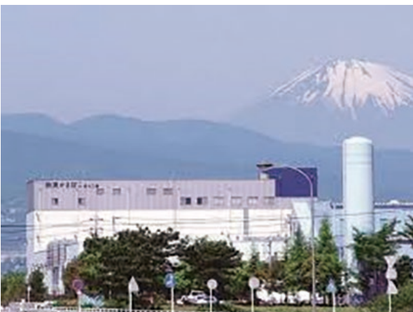
鈴廣かまぼこ恵水工場

地中熱の利用には、地中熱交換井の整備や地下水の確保が課題となるが、同工場は、地下水の豊富な地域に立地しており、もともと工業用水に用いていた休止中の井戸を有していたことから、井水を利用することで地中熱利用を実現した。また、既設のファンコイルを流用することにより設備費用を抑えた。