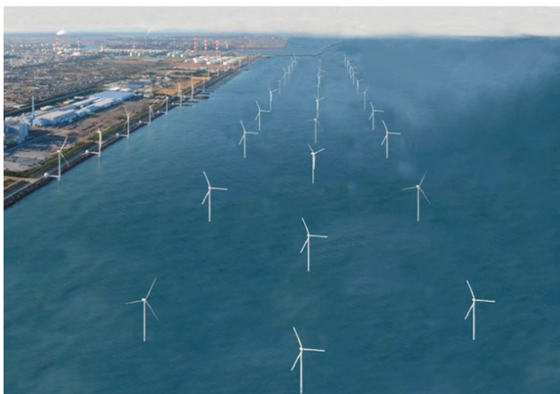
鹿島港沖大規模洋上風力発電イメージ図